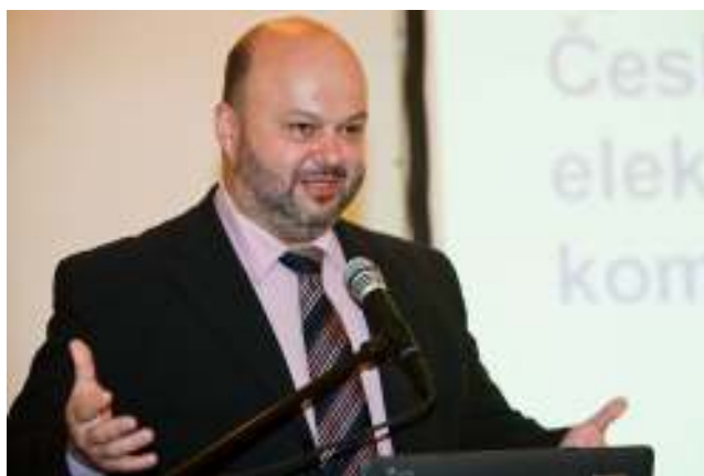
Ministr vnitra MARTIN PECINA zahajuje výroční konferenci ČAEK

Martin Pecina – ministr vnitra České republiky